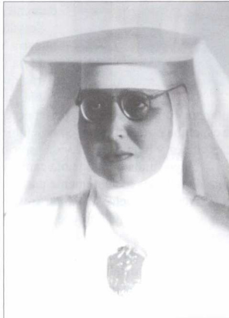
Madre Fundadora de la Congregación

Damos gracias al Señor porque en la humildad y pequeñez de nuestra Madre Fundadora quiso hacer cosas grandes, al hacer nacer la Iglesia, a través de ella, esta Obra, para que todas nosotras adorándole día y noche, seamos testigos vivos de su real presencia y permanencia en la Sagrada Eucaristía.